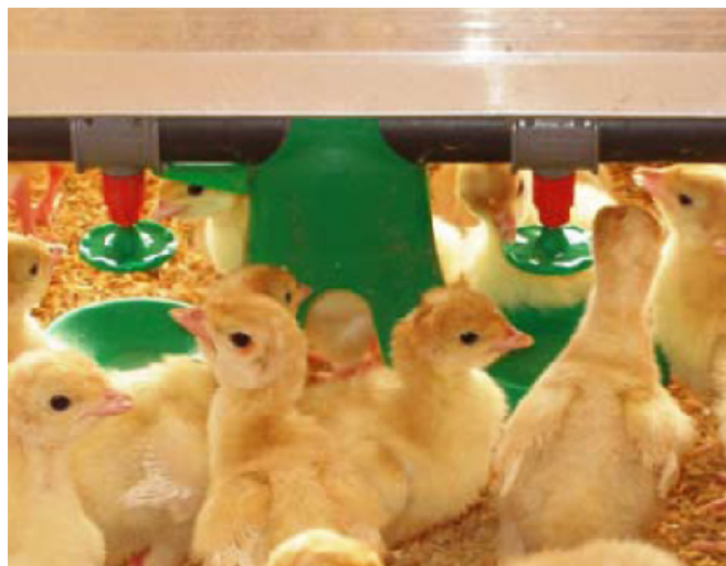
Patentado – Patentes Adicionales Pendientes