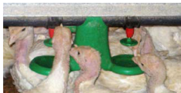
El bebedero para pollitos ADVANTI-FLOW® de Chore-Time está diseñado para ser usado con aves de hasta seis semanas de edad

La información proporcionada en esta tabla es solo de referencia. El granjero debería seguir las recomendaciones de su integrador. La altura del sistema y/o los ajustes de la columna de agua pueden variar