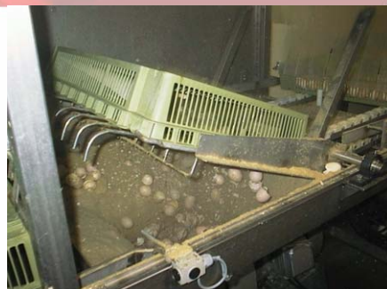
El volteador de bandejas vacía una cesta de nacimiento girándola 180 ° y expulsando su contenido

Opcionalmente, el volteador puede ser equipado con un extractor de polvo en su parte superior.